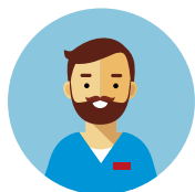
Biologo, Farmacista, Pers. San. Aree Intensive Infermiere: taschino profilo rosso OSS, OTA, Ausiliario: taschino profilo verde Tecnico Sanitario: taschino profilo bianco