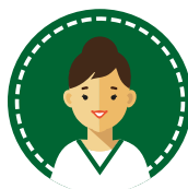
OSS – OTA Ausiliario