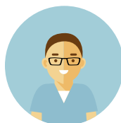
Personale di: Fisica Sanitaria Ingegneria Clinica