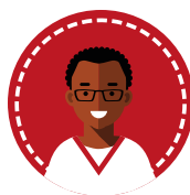
Infermiere Infermiere Pediatrico