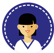
Studente: Infermieristica Fisioterapia Igiene Dentale